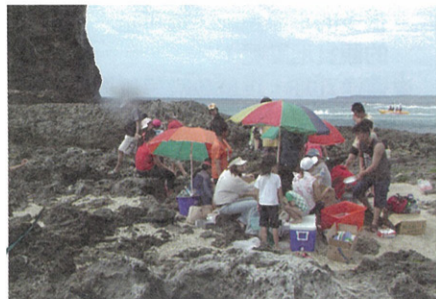
船帆石珊瑚礁上烤肉的人們