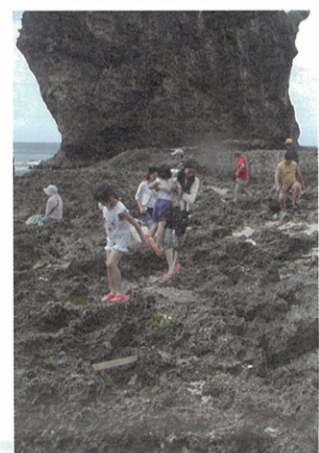
穿拖鞋在礁石上走很危險

在墾丁的海邊面對這樣一個突兀的畫面，我的第一個反應是：可不可以報警或報告國家公園？其實我並不知道國家公園是否有法可管，也不知道這是否違反了哪一條法律，不過離譜的事情會