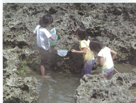
接近自然也要有正確的知識和態度(捕撈回家對嗎?)

就任其乾死在陸地上，曝屍多日之後發出陣陣惡臭。這也是「態度」問題，顯然這些釣客認為某些魚是「有用的」，某些魚是「沒有用的」，卻忘記所有的魚都是生命。人類為了生存和追求更好的生活，難免會損及其他生命，就像自然界弱肉強食的生存法則一樣，但是不懂得將其他生命視為與我們一般的生命，就會妄大自尊，失去謙卑的心，最後仍然受到自然的反噬。