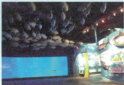
活體的鮪魚展示缸

「鮪妮道來」—鮪魚生態特展展示地點在海生館世界水域一樓展示區，共有「鮪鮪道來」、「豐功鮪業」、「嘆鮪觀止」、「鮪屈求全」、「見鮪知著」與「大有可鮪」等六大主題區。展區中除了針對鮪魚的種類、特徵、分佈與主要分類關鍵等做完整且全面的介紹外，更將對台灣鮪魚漁業文化與歷史演變作精彩回顧，並導入黑鮪魚的營養及因其價值而被過量捕捉的意象，進而強調控制捕撈量與維持資源永續性的重要，能讓參與的民眾寓教育於娛樂，歡迎民眾前往海生館一同共襄盛舉，來一場知性饗宴！