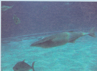
印魚獨自悠悠於海中

就在此時突然有人喊說：「鯨鯊身邊有許多鯨鯊寶寶跟在旁邊，與鯨鯊媽媽相伴一起游泳，畫面好溫馨喔」。這些魚有些以倒頭栽的姿勢貼在鯨鯊的背上，有些則以頭部貼在鯨鯊的腹部，還有一些跟在身體下方，如