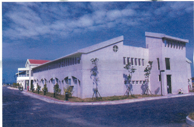
海生館生技研究的重地--研究大樓