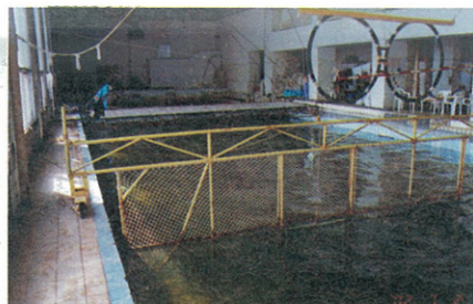
由游泳池改建之海獸畜養池設備稍嫌簡陋

自我國野生動物保育法實施以來，這是首件鯨豚類輸入案例，特別為各界所關切，因此在六月廿六日於本館舉行「白鯨引入說明會」邀請臺灣有關鯨豚的保育組織，包括台灣鯨豚協會及