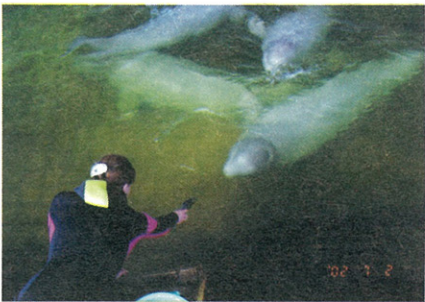
莫斯科市之畜養池，工作人員正餵食我們的小白鯨

黑潮海洋文教基金會及和鯨豚有關之屏技獸醫系教授參與，除說明本館引進白鯨的努力成果及未來之目標外，也希望各先進提供意見，務必使這北方嬌客能有最好的照顧。