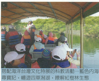
搭配海洋台灣文化特展的科教活動—藍色內海尋寶記，暢遊四草瀾湖，瞭解紅樹林生態

台南七股台灣鹽博物館以「鹽的母親—海洋台灣」為主題。大海，是鹽的家，台灣的鹽，更是台灣海洋文化資產的結晶。一粒鹽，從歷史上，可以看見台灣的發展與蛻變，西元1665年鄭成功參軍陳永華引進淋滷曬鹽法那一刻起，展開台灣曬鹽史，歷經日治時期的現代化工業製鹽觀念到2002年台灣停止曬鹽，台灣鹽業主宰了經濟發展的脈動，其盛衰見證了國際化的未來。從地理上，經由鹽場數次搬家路線可以瞭解台灣海岸線的變遷，後代子孫可以從與「鹽」相關的地名推論出當地或許曾經與運鹽、賣鹽、製鹽...有過的互動。從展出中更可以體會鹽田兒女打拚出台灣人精神的一面，以及思考鹽的文化價值。