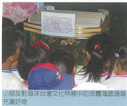
小朋友對海洋台灣文化特展中的活體海底珊瑚充滿好奇

基隆國立海洋科技博物館籌備處以「海風與漁鄉之戀」為主題。藉由曾經是台灣近海重要的漁船---木製「舢舨」（罾子船）的製作紀錄，及其使用的漁具漁法與捕獲的水產生物，娓娓道出先人與海洋共生的智慧；象徵過去漁村互利合作的牽罟、罟寮，也在此次展出中，許多南部觀眾對這座罟寮、及其他展示的八卦網、叉手網，尤其印象深刻，因為這都是他們童年的記憶或經驗。透過展出也傳遞了台灣漁村文化的片段剪影，真實反應出生活記憶、造船老師傅技藝傳承與保存的重要性。