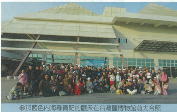
參加藍色內海尋寶記的觀眾在台灣鹽博物館前大合照

環境，包含動植物及微生物間的平衡關係。在整個生態缸中，各種生物都各自具有存在的意義，而且彼此互相影響。