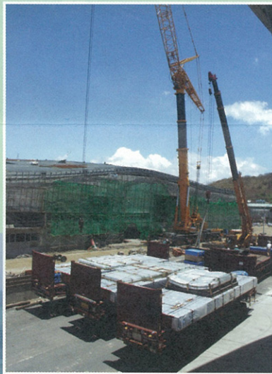
↑ 海藻森林展示缸安裝用之壓克力玻璃

興建中的世界水域館主題之一的巨大海藻森林，為大約10公尺高的巨大活體水缸展示，缸壁壓克力厚達50公分之多，造價將近上億元。為將此巨大壓克力玻璃移入館內，三館工程處特定調動80噸重的巨大吊車執行此項關鍵任務，在眾人協力之下，小心翼翼地將巨大的玻璃片由屋頂吊入館內，進行安裝的工作，三館的工程，由此向前邁進一大步。