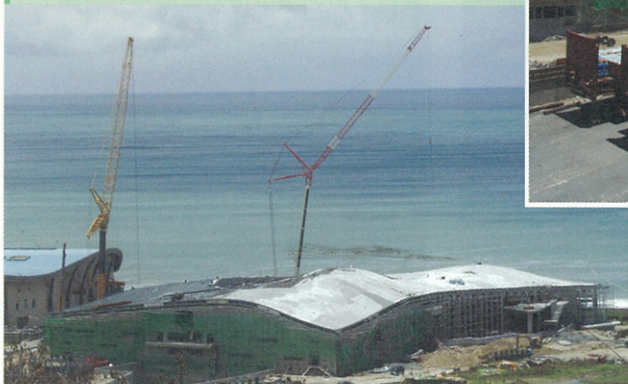
← 興建中的世界水域館