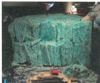
櫥窗中冰河入海口的模型