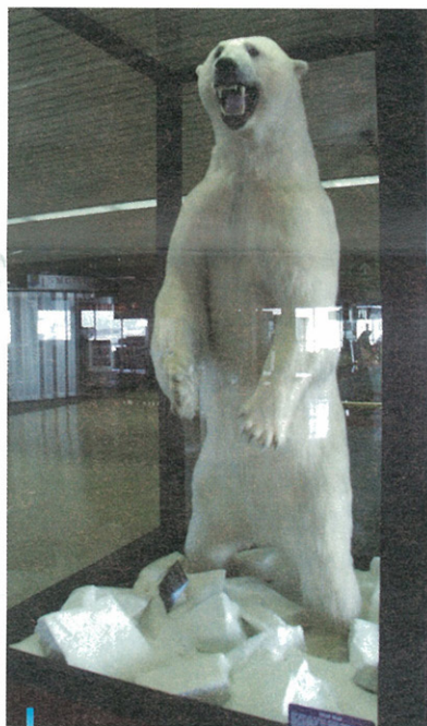
安哥拉治機場的北極熊踩在浮冰上