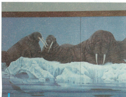
遊客大廳大型壁畫中海象聚集在浮冰上的影像

浮冰到底長得什麼樣子？摸起來的感覺是如何？是完全晶瑩剔透？很乾淨嗎？乍聽之下，這些似乎是簡單的問題，但若要說的詳盡些，一般人大概只能根據對生活中的冰塊或是路邊攤的刨冰片面印象，概略的描述一下。然而片段的資訊並無法使展示造景師，對浮冰的外型與質感獲得足夠的認識與了解，而在博物館展示主題中忠實地呈現出它的原貌，雖然網路上不乏冰山的報導與圖片，但是光看圖片或是高畫質的數位影片，仍無法比得上親眼目睹及親手的觸摸所帶來的真實感。