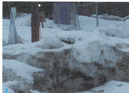
道路旁泥巴與鹽巴的雪堆