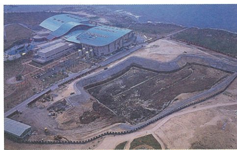
世界水域館施工鳥瞰

。目前展示主題的規劃，已經邁入細部設計的階段，預計在民國九十五年一月一日正式營運。