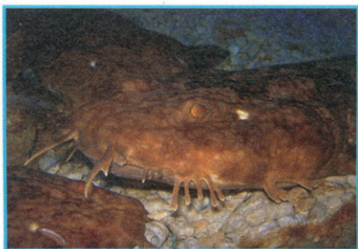
▲斑鬚鯊嘴邊的這些肉垂，像不像長滿鬍鬚子的老爺爺？