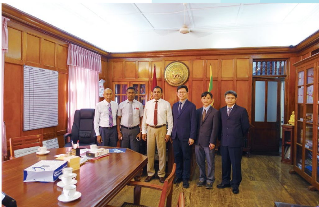
107年12月本館陳副館長率團赴佩拉德尼亞大學考察交流及參訪座談，期間與該校Dissanayake校長會面。