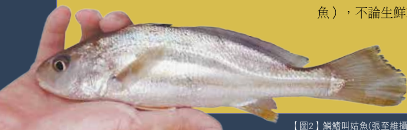
【圖2】鱗鰭叫姑魚

人們利用石首魚會叫這種特性，靠著追蹤牠們的聲音來捕捉牠們，因此中國人很早就開始食用石首魚，尤以中國東南沿海一代為多，東南沿海居民喜慶、送禮、宴客的大菜中最喜愛的一道菜之一就是石首魚（大黃魚），不論生鮮或醃製都能上桌。而