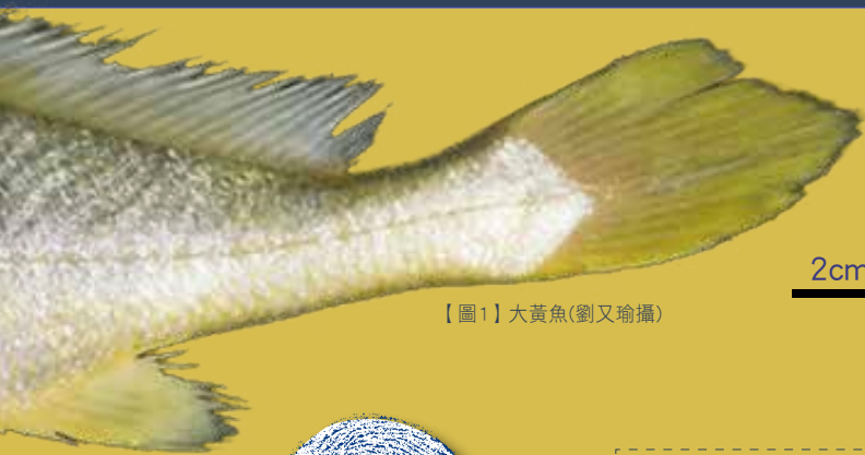
【圖1】大黃魚