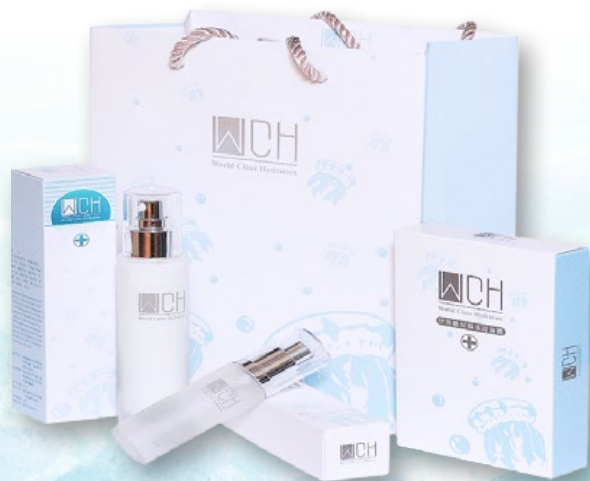
圖1.本館與美和科技大學簽署合作備忘錄。 圖2.海生館養殖的仙后水母，約手掌般大小。 圖3.仙后水母美妝產品。 圖4.東京美容展。