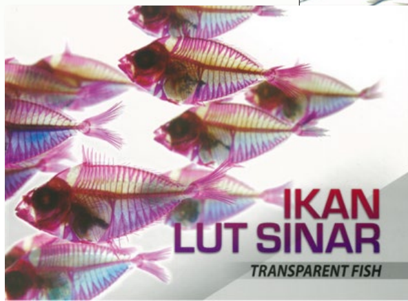
▲「透視·魚」馬來文譯版之封面。