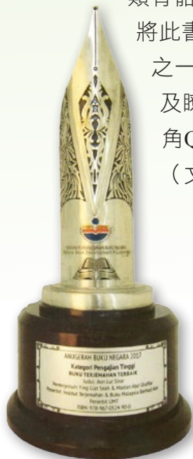
▲『馬來西亞國家出版品』最佳翻譯獎獎盃。