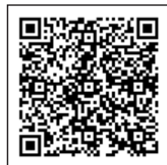
▲中文版「透視·魚」書籍介紹網站QRcode。