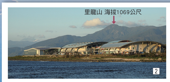
圖1. 里龍山山頂設有『一等三角點』，為內政部所設立的永久測量控制點