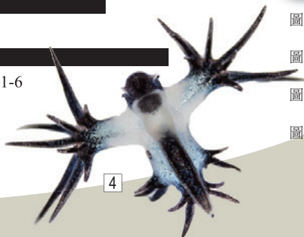
圖1. 本書封面為二個泳鐘體串連的馬蹄水母 ( Hippodius hippopus ) 圖2. 殼表附滿櫛茗荷之侏儒紫螺 ( Janthina umbilicata ) 圖3. 瓦爾迪瓦紡錘魷 ( Liocranchia valdiviae ) 背面觀 圖4. 緣邊海神海蛞蝓 ( Glaucus marginatus ) 腹面觀