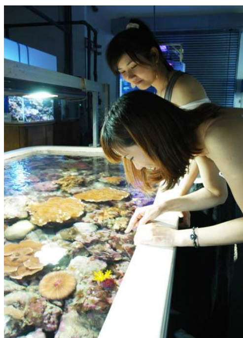
水族實驗中心-水桌