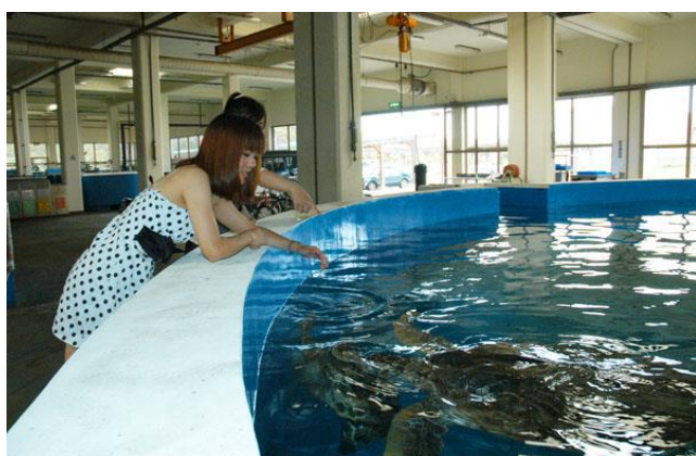
水族實驗中心-海龜池