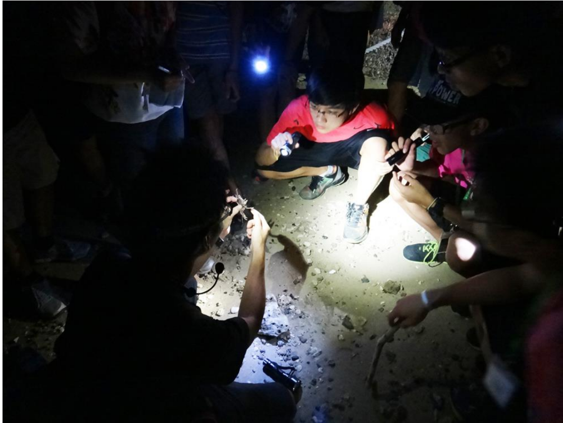
與鐵甲武士的約會-夜探後灣陸蟹