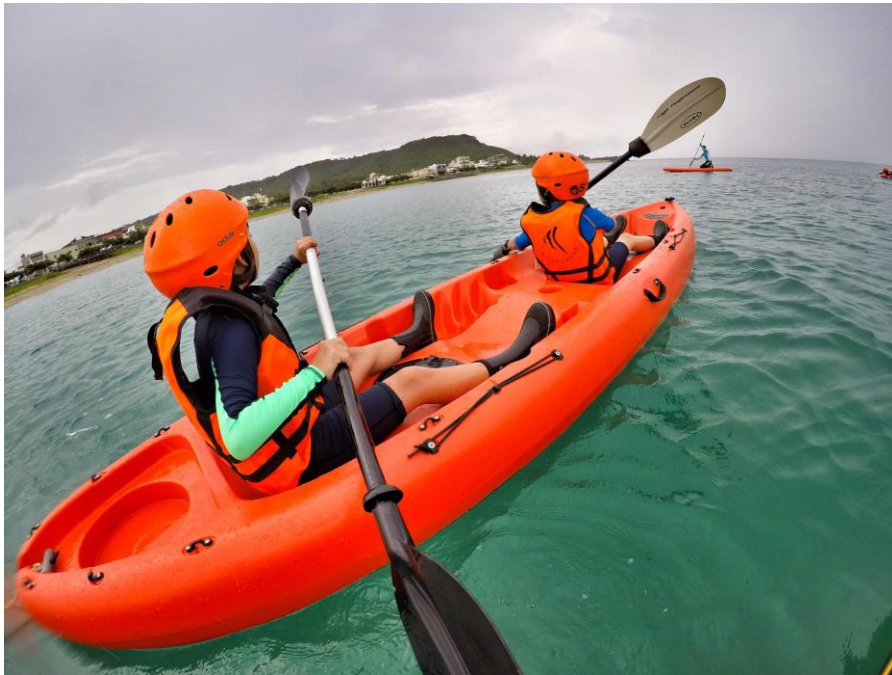
親近海洋-獨木舟體驗