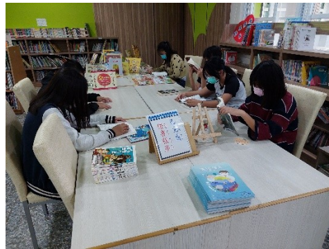
圖 4 車城國小學生閱讀圖書狀況。