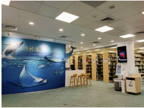
圖 1 海生館圖書館改造後之現狀。