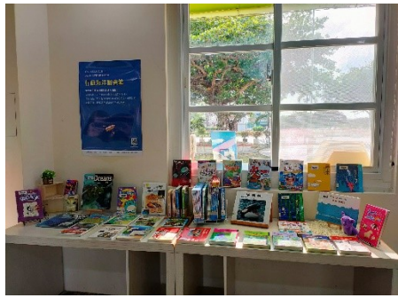
圖 5 與在地車城國小合作，設置海生館推出的行動海洋圖書館專區，供學童閱讀。