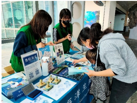
圖 3 海生館展場推廣《奧秘海洋》科普雜誌活動。