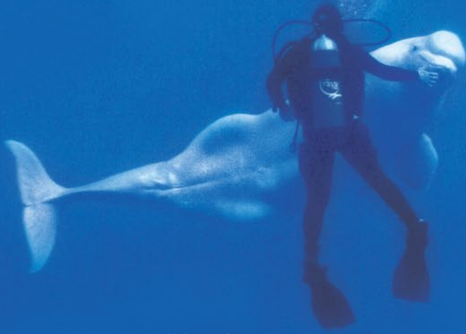
飼育員與白鯨於水下互動