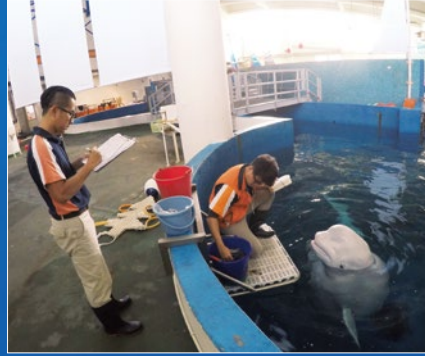
獸醫師及飼育人員餵食白鯨並同時觀察記錄。