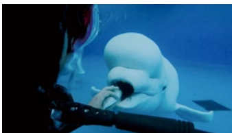
飼育員與白鯨進行水下互動

白鯨智商如同人類七、八歲的孩童，非常調皮，因此飼育員必須常常與白鯨互動，刺激並增加白鯨的行為豐富化。每當白鯨情緒不佳時，飼育員也要有耐心的去安撫牠們，主動去親近牠們，因此飼育員與牠們的相處常常需要付出更多的耐心及極高的觀察力，大家全心全力照護，就是為了要確保白鯨有健康愉悅的身心。