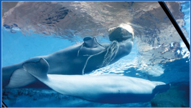
正在玩玩具的白鯨

快得知白鯨身體狀況的檢查。當白鯨前一天沒睡好時，或是消化不良時，就會產生出濃濃的口臭味，這時會誘導白鯨吐水來進行漱口，並持續追蹤觀察。以上種種的健檢，都是為了讓白鯨可以保持身體健康，頭好壯壯！