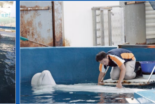
與白鯨互動的每一個動作都跟醫療行為緊密結合，圖中飼育員正在替白鯨檢查身體是否有外傷。