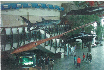
懸吊於大廳的大王烏賊模型，這可是1:1大小的哦

走進國立海洋生物博物館展示大廳，抬頭一看，便可看見許多海洋生物的模型高掛在屋樑上，其中有一隻特別亮眼的生物，牠有著磚紅色的外表，和牠身旁的巨型生物模型比較起來，那細長的身軀便非常地顯眼，牠便是具有濃厚神秘色彩的「大王烏賊」—the giant squid。大王烏賊的屬名是—“Architeuthis”，意指“the king of the squid”，烏賊之王。而在許多古老的傳說中，牠又被稱為Kraken，挪威語中意指“傳說中的大海怪”。